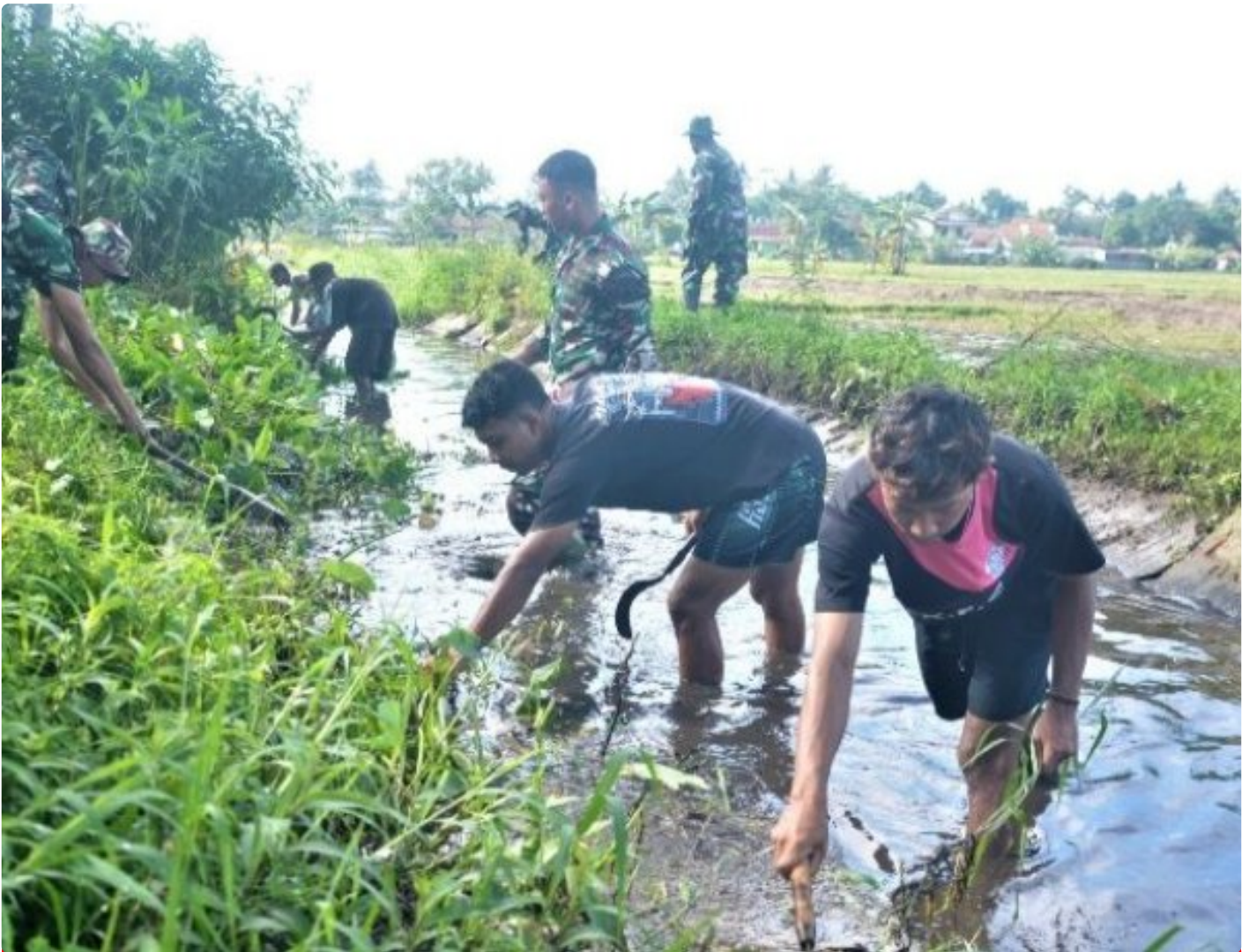
Sungai Si Rompang dibersihkan TNI Korem 071 Wijaya Kusuma

BANYUMAS - Sungai Si Rompang atau kali dalam sebutan masyarakat Banyumas, yang melintas tepat di belakang lingkungan Makorem